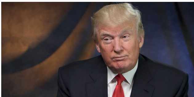
ดอนัลด์ ทรัมป์ (Donald J. Trump)

“จงใช้เวลา ควบคุมความเสียหาย จากการขาดทุนที่อาจเกิดขึ้น ส่วน...กำไร จะดูแลตัวมันเอง”